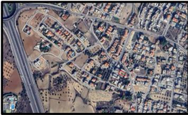
7.3 Πολεοδομική Ζώνη